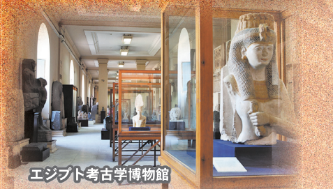
エジプト考古学博物館