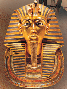
ツタンカーメン黄金マスク