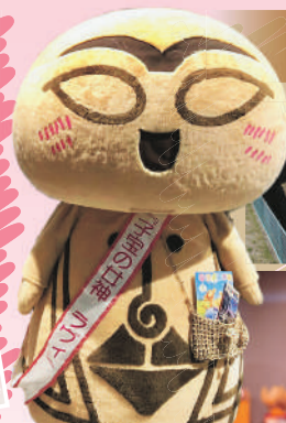
土偶キャラ「子宝の女神 ラヴリ」